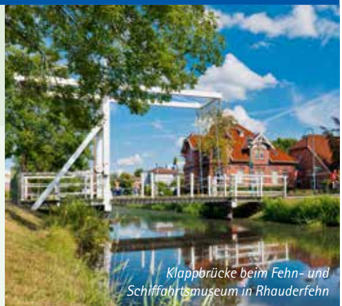
Klappbrücke beim Fehn- und Schifffahrtsmuseum in Rhauderfehn