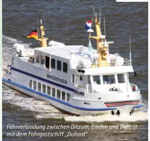
Fährverbindung zwischen Ditzum, Emden und Delfzijl mit dem Fahrgastschiff „Dollard“

Qualitativ hochwertige Mietfahräder oder E-Bikes auf Wunsch (gegen Aufpreis)