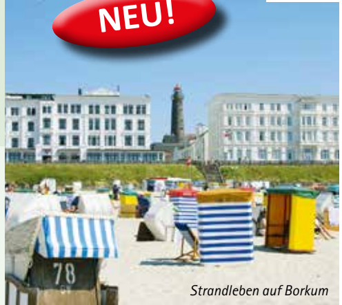
Strandleben auf Borkum