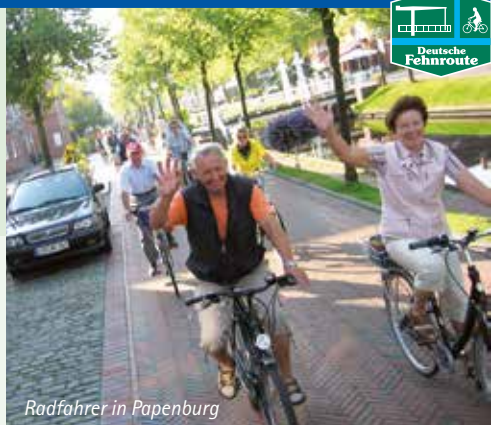
Radfahrer in Papenburg