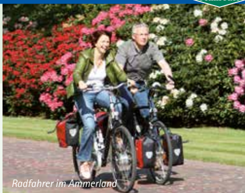
Radfahrer im Ammerland