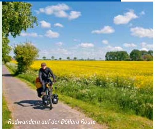
Radwandern auf der Dollard Route

Qualitativ hochwertige Mietfahräder oder E-Bikes auf Wunsch (gegen Aufpreis)